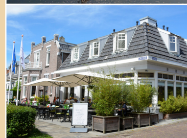
Hotel Om de Noord